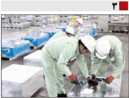
۳ معاون اقتصادی و مالی فولاد مبارکه : فولاد مبارکه با زدهی ۴۳ درصدی را عاید سهامداران خود کرد